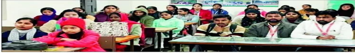
एलबीएस महाविद्यालय में आयोजित प्रतियोगिता में मौजूद छात्र-छात्राएँ।